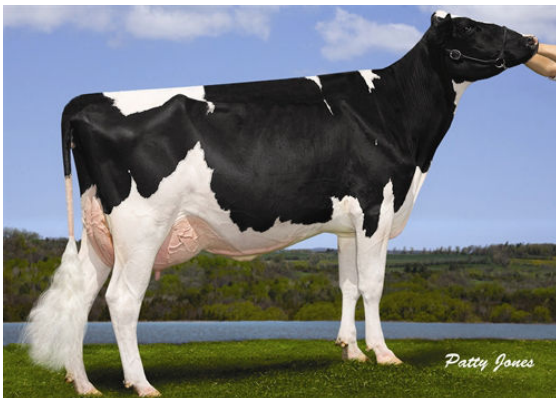
MS CHASSITY PLN CHACHING Dam